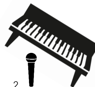
2 Piano / Hammond / Backing-Voc Monitor-Box