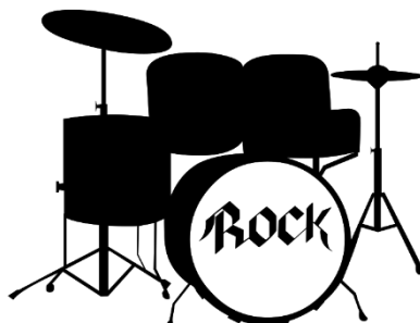
4 Schlagzeug In-Ear-Monitoring